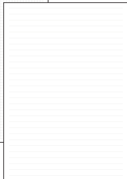
INTERNO A RIGHE

Il file di Indesign si presenterà così, già in misura e pronto per la realizzazione. Puoi impaginare nell'area azzurra. Le aree rosse non saranno visibili a prodotto ultimato.